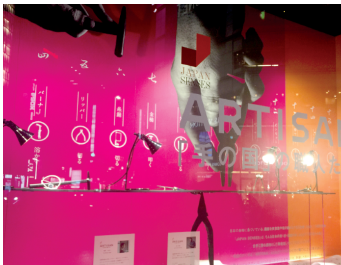
本館メインウィンドウで展示されました