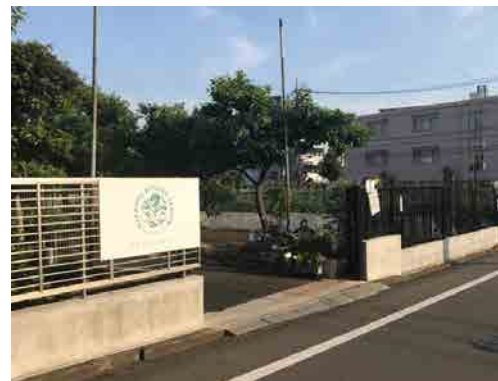
中杉キッチンガーデン（農場）付近

桜丘4丁目付近。世田谷育ちのお野菜とお花苗を育てています。 等々力溪谷に注ぐ谷沢川の源泉は、どうやらこのあたりらしいので、行ってみましょう