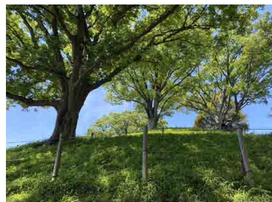
玉川野毛町公園 野毛大塚古墳

全長82メートルの帆立貝式前方後円墳です。周濠を含めると全長104メートルとなり、関東地方では群馬県の女体山古墳に次ぐ規模を誇ります。 上に登ると気持ちいい見晴らしが見られます。